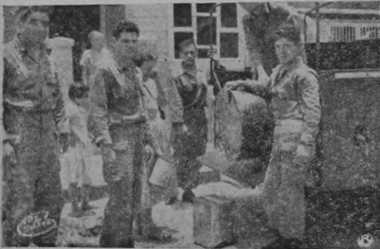
Otro aspecto de la distribución de agua que en las calles de Montes de Oca hizo ayer la Guardia Civil