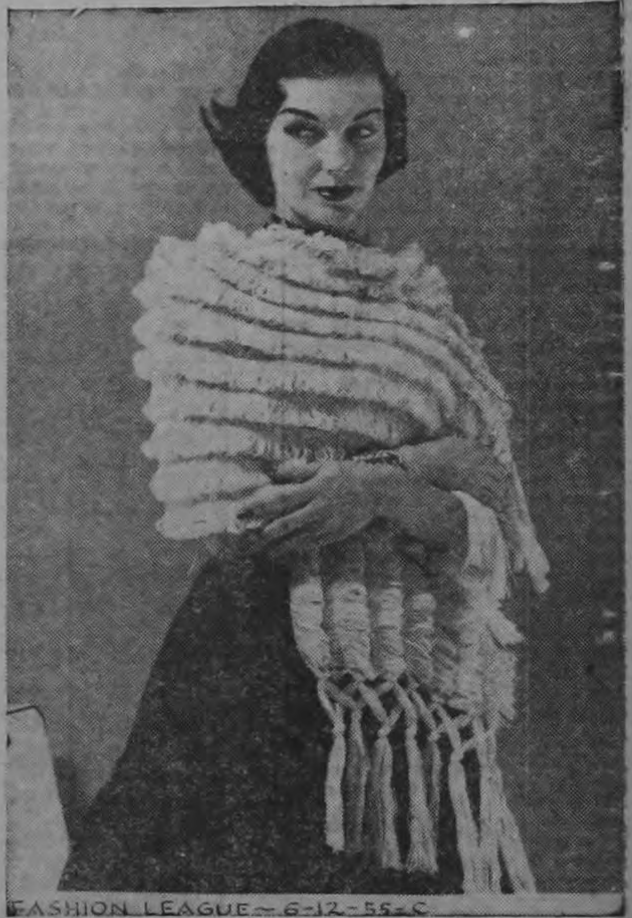
FASHION LEAGUE - 6-12-55-C

La estola es ahora una prenda indispensable en las noches calurosas, porque permite usar de noche trajes sin chaqueta o de escote pronunciado.