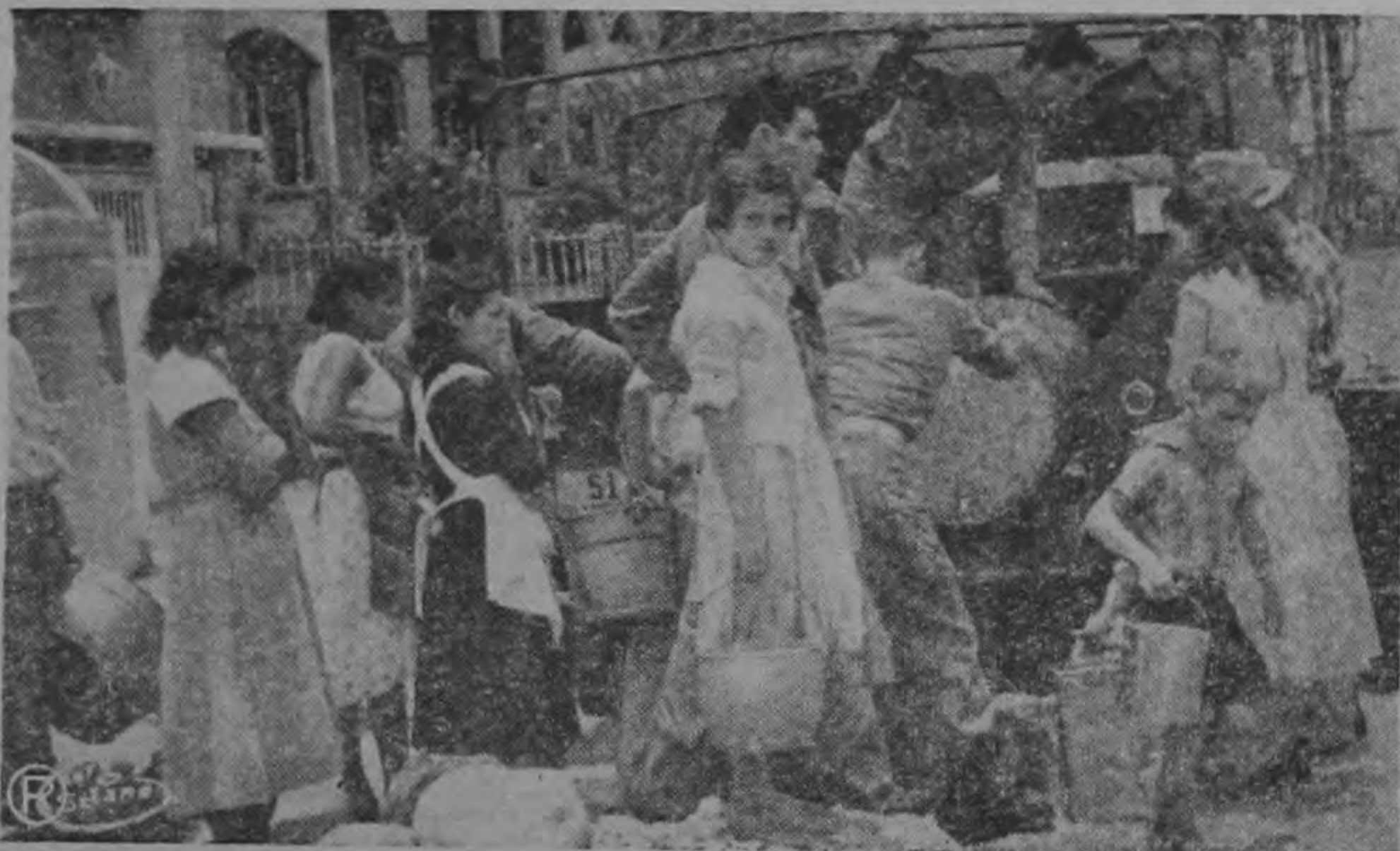
Los acongojados vecinos de San Pedro se aprestan a recoger el agua que en estaño les reparte la Guardia Civil.