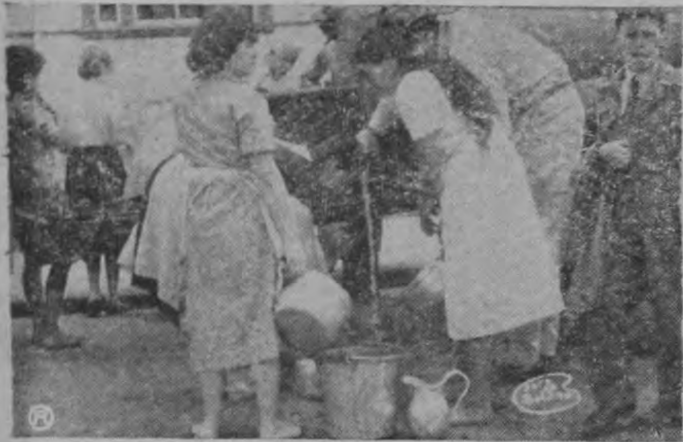
Elementos de la Guardia Civil vacían el contenido de uno de los estacioneros de agua con que concurren a aliviar, en parte muy mínima, desde luego la congoja de los moradores de San Pedro, que durante siete días se han visto privados del agua de la cañería.

Igualmente, durante todos estos días, las bombas de incendio del Instituto de Seguros han estado dedicadas a la samaritana labor de repartir agua entre los montesdeoqueños.