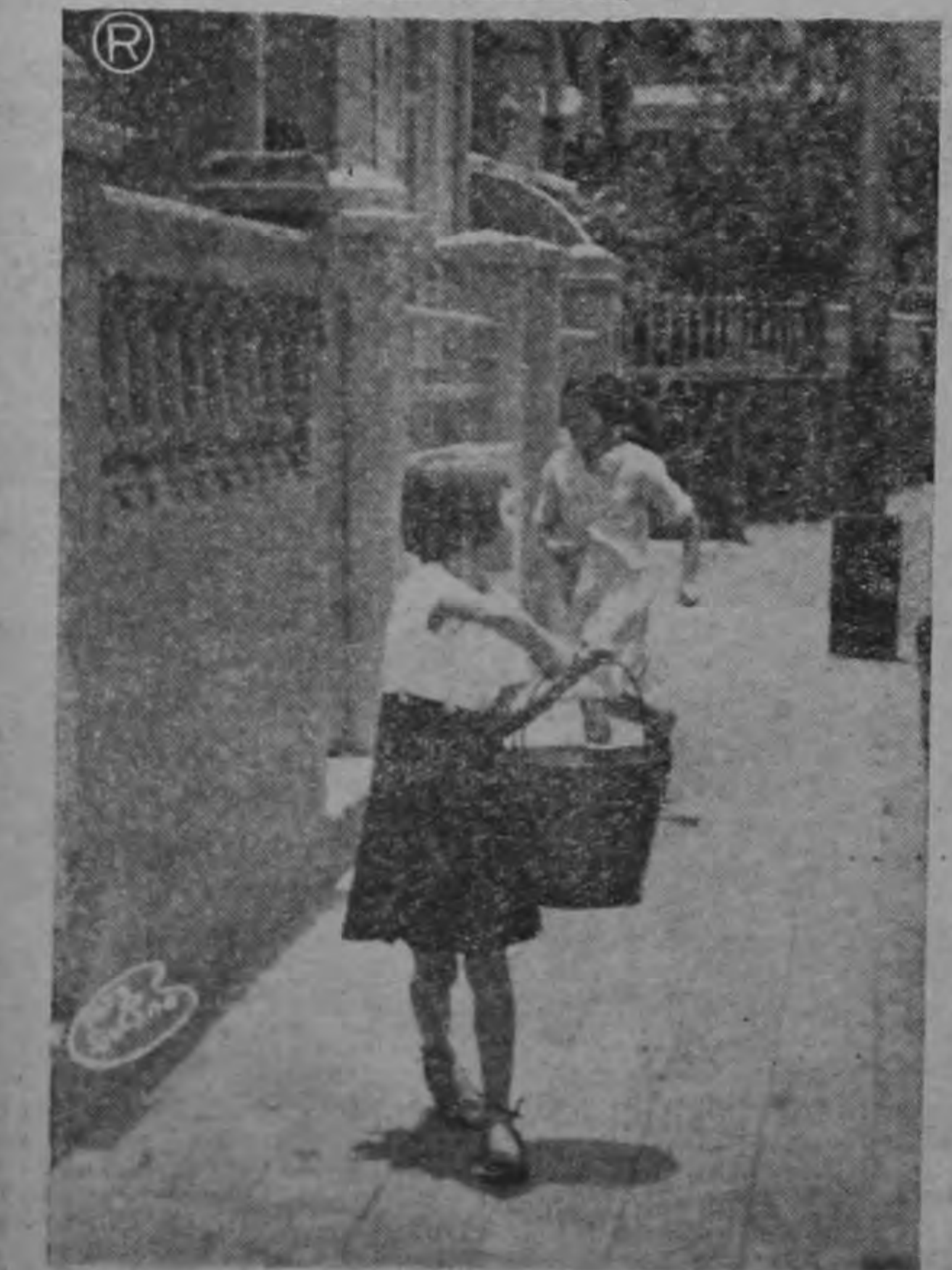
Estas niñas escolares también cooperan con sus familiares en recoger agua, para llenar las necesidades más urgentes de su casa.