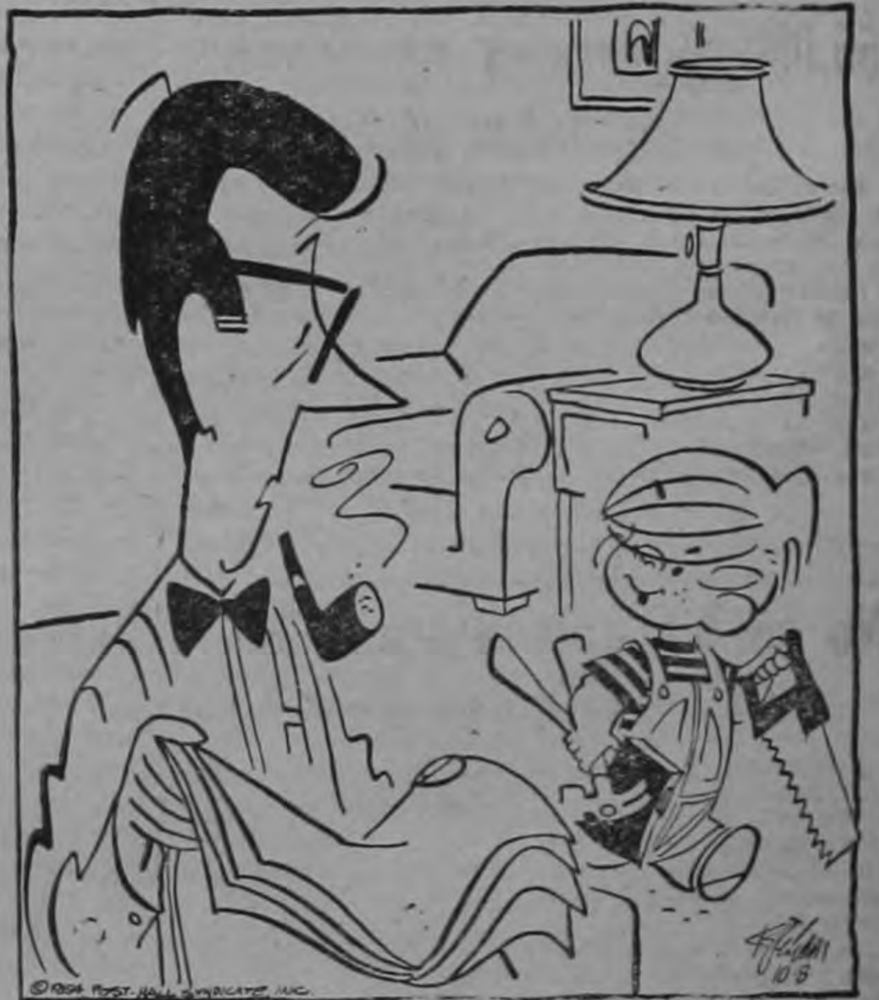
—Te apuesto a que no sabe lo que voy a hacer...